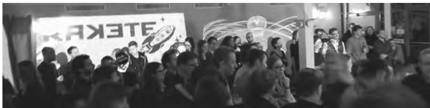
Rakete, eine Idee des Vereins Hochneun in Kooperation mit GZ Bachwiesen

Details & Infos: www.facebook.com/raketebar oder www.raketebar.ch